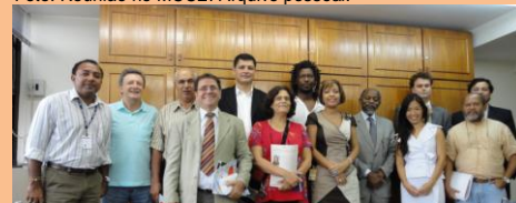
Foto: Reunião no MCCE.