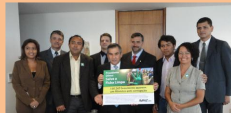
Foto: Reunião na Presidência da República.