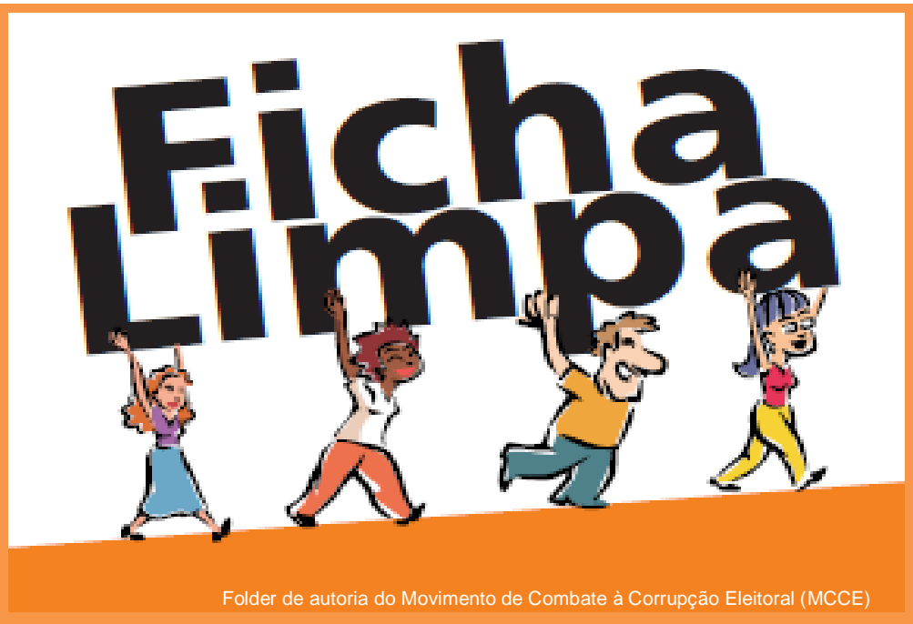
Folder de autoria do Movimento de Combate à Corrupção Eleitoral (MCCE)