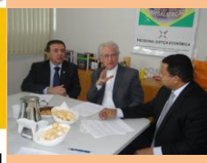
Reunião CNBB e OAB em defesa da Ficha Limpa.