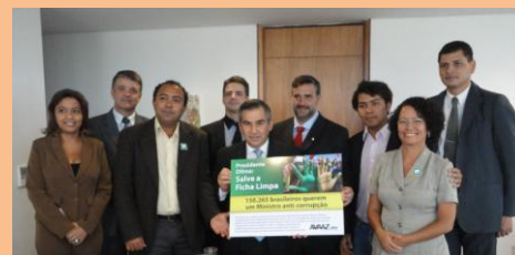
Foto: Reunião na Presidência da República.