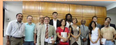
Fotos: Reunião no MCCE.